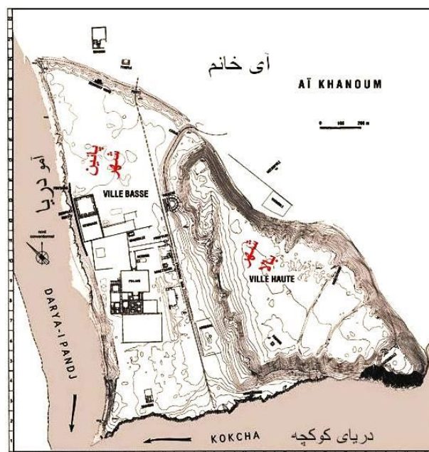
نقشه شهر آی خانم

در اثر تحقیقاتی که در آی خانم صورت گرفت، عده از باستانشناسان فرانسوی به این نظر رسیدند که این شهر باید چندی بعد از مرگ اسکندر در کنار رود آمو و دریای کوچک در قرن سوم ق.م. اعمار گردیده باشد. ازینرو اسکندریه ای نیست که همه فکرمیکردند در جوار رود آمو به امر وی اعمار گردیده، اما برخی از دانشمندان این نظر را رد نموده و پس از مطالعه اسناد تاریخی کهن به این نتیجه رسیدند که این شهر تاریخی همان اسکندریه ایست که اسکندر در قرن چهارم ق.م اساس آنرا گزارده، در قرن سوم ق.م انتاکیوس پسر سلوکیوس جنرال اسکندر در آن تعمیراتی نموده و در قرن دوم ق.م اکروتیدیس Eucratides شاه یونان باختری آنرا به شهر آبادانی تبدیل نموده که بنام وی بنام شهر اکراتیه Eucratideia اکراتیدیا یاد گردیده. شهر اکراتیه به تلفظ شرقی و اکراتیدیا به تلفظ یونانی که امروز بنام محلی آن «آی خانم» در زبان ازبکی بمعنی مه بانو مشهور است، بشکل مثلث گونه ای در میان رود زرافشان کوچک و دریای پنج دربخش شرقی آمو دریا قرار دارد و بگمان اغلب شهر تجارتهی مهمی در میان ایالات غربی چین و شهر زریاسپه یا بلخ در سرزمین باختر بوده است.