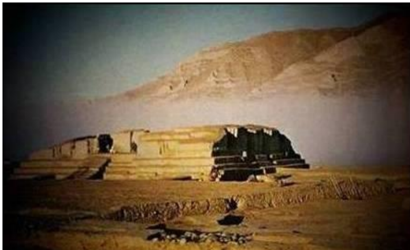
نمای از معبد خارج حصار

جاده مستقیمی از مرکز محوطه بیرونی معبد گذشت و به زینه های مقابل درب ورودی نیایشگاه در وسط این ساختمان بزرگ وصل میگردید. درب ورودی به دالانی باز میشد که در انتهای آن عبادتگاه بزرگی قرار داشت. در چهار سمت عبادتگاه اتاقهای کوچکتری برای نیایش های خصوصی اعمار گردیده بود تا در مواقع مختلف قابل استفاده باشد. برخلاف معبد مستطیل شکل خارج از محوطه شهر، معبد داخلی بالای طرح مربع شکلی در کنار جاده عمومی در نقطه مزدحمی بنا یافته بود و در داخل آن علاوه از عبادتگاه مرکزی اتاق های مطالعه و نیایش های خصوصی نیز وجود داشت. این ساختمان نیز بالای تهداب سه مرتبه ئی استوار بود که از نگاه اندازه قاعده به رأس بتدریج خورد تر میگردید.