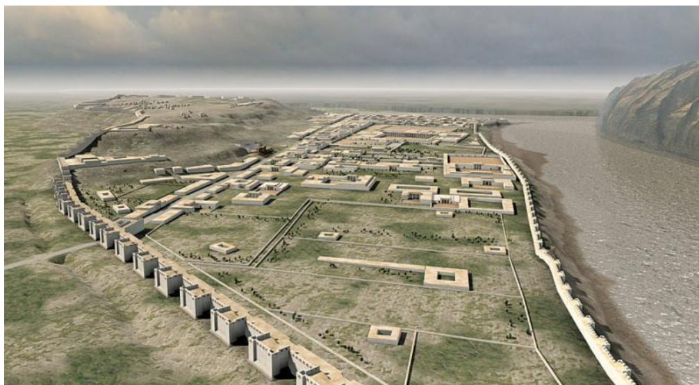
تصویر کامپیوتری شهر آی خانم به اساس یافته های باستانشناسان

با آنکه شهر آی خانم از دوطرف با دریاهاى آمو و كوچه محاط بود، باآنهم این شهر باستانی توسط دیوارهای قطوری محافظت میگردد. در هر بخش این دیوار دفاعی با صلابت استحکامات نظامی و برجهای دفاعی مجهزی در فاصله های معینی اعمار گردیده بود تا شهر اترکیه را از خطر تهاجمات محفوظ نگهدارد. باستان شناسان بقایای این دیوار طولانی را در حین حفريات پیدا نمودند ه اند.