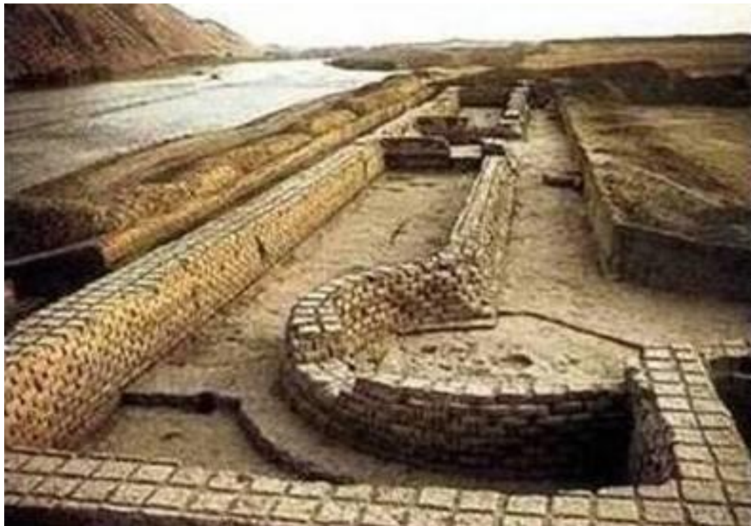
نمای از برنده قصر آی خانم بر فراز رود کوکچه

این تصویر برنده قصر آی خانم را با چشم انداز وسیع آن بر فراز رود خروشان کوکچه نشان میدهد که زمانی با ستونپایه های مرمرین مزین بود. هویداست که سبک خشتکاری آن از شیوه معماری یونانی با دیوارهای بنا یافته از سنگ های مکعب و مستطیل شکل تفاوت دارد.