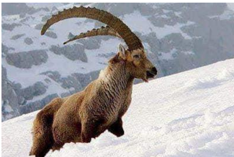
عکس های آهوی ماکوپولو در ارتفاعات پامیر بدخشان افغانستان

آهوی مُشک ختن که در ادبیات شاعرانه و دربار سلاطین شرق و غرب، کلیسا ها و مساجد از شهرت بسزایی برخوردار است نیز یکنوع آهوئی است با رنگ نصواری مایل به سیاهی و دارای دو دندان نیش مانند دراز در پیشروی دهان که رایحهٔ معطری در زمان جفت گیری از نافهٔ آهوی نر متصاعد می‌گردد که با وصف انکشافات تکنالوژی در این عرصه تاکنون موفق نشده اند تا صد درصد شبیه این عطر را تولید کنند. قیمت مُشک ختن که از نافهٔ آهوی نر بدست می‌آید و هر گرام آن توانایی معط ساختن میلیون ها متر مکعب هوا را دارا می‌باشد، در بازار جهانی بیشتر از قیمت طلا است و این امر با شکار بی رویهٔ این حیوان باعث گردیده که نسل این نوع آهومنقرض گردد. هر آهوی نر مُشک ختن در اندام جنسی و نافهٔ خود بطور متوسط دارای ۲۵ تا ۳۰ گرام مُشک ختن می‌باشد.