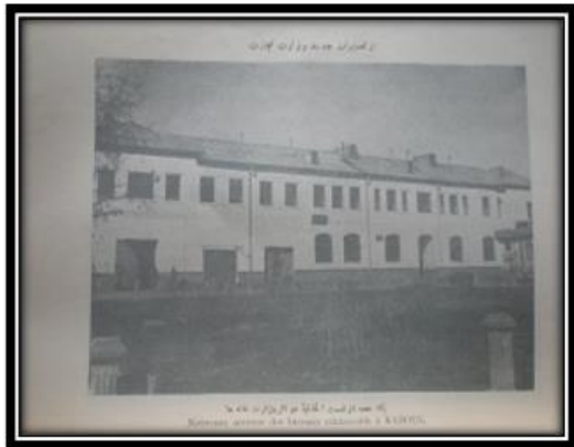
یکی از تعمیرات وزارت تجارت که حالا تخریب گردیده است

در اواخر سال ۱۳۲۸ و اوایل ۱۳۲۹ در تشکیل وزارت اقتصاد تغییراتی رخ داده، بعضی ریاست ها در تشکیل وزارت جدیداً ایجاد و برخی از تشکیلات بنابر اقتضای زمان از بین رفته و وظایف آنها به شعبات دیگر محول شد. در سال ۱۳۳۰ ریاست صنایع وزارت اقتصاد ملی برای ایجاد صنایع جدید اقداماتی را رویدست گرفته بعد از ارزیابی های همه جانبه تصمیم اتخاذ شد تا در نواحی کابل به تاسیس فابریکات سمنت، شیشه سازی، سگرت