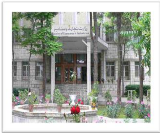
تعمیرفعلي وزارت تجارت وسرمایه گذاری

در سال ۱۳۴۱ الی ۱۳۴۳ امور محاکم و حکمیت های تجارتي بوزارت عدلیه انتقال گردیده و بالمقابل رسیدگی از