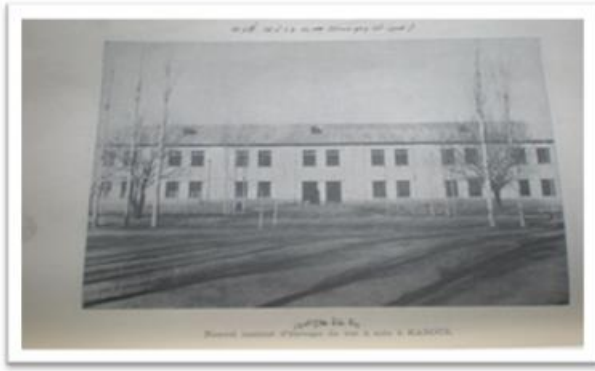
تعمیر مرکز تحقیقاتی وپبله وری در علاوالدین کابل

نیاز زمان و تعهدات بین المللی، تلاش درجهت بهبود توأزن بیلانس تجارتي میگردید. وزارت تجارت در سال ۱۳۳۶ به تعمیرفعلي که یکی از بنا های با عظمت و تاریخی شهرکابل بوده و در سرک دارالامان در جوار تعمیر پارلمان فعلی کشور موقعیت دارد انتقال وجابجا گردید. ریاست مارکیتنگ در سال ۱۳۴۱ بریاست احصائیه وپلان تعدیل گردیده و همچنان ریاست کمیسیون نرخها در سال ۱۳۴۳ ازبین رفته وظایف آن به شعبات دیگر سپرده شد وشعبه بنام موسسات و سرمایه گذاری وشعبه شرکت ها و بیمه در تشکیل گرفته شدومتباقی تشکیل وزارت در ظرف ۹سال بدون تغییر باقیماند.