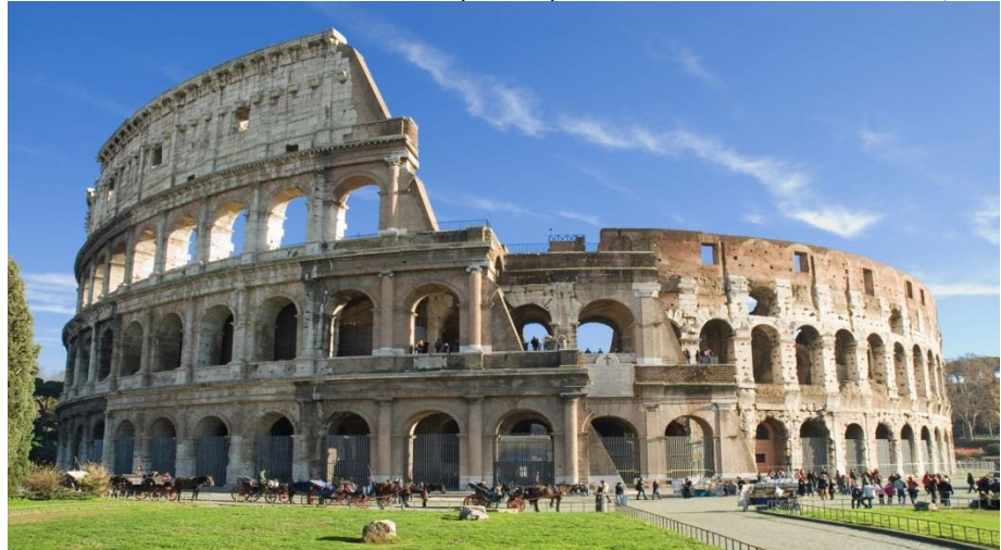
Colosseum amphitheater in Rome, Italy, 70-72 AD Figure 2-

در روم قدیم ساختمان آمفی تناتر در پهلوی ساختمان دیگر مورد علاقه خاص رومیان قرار داشت و با اخذ الهام از استادیوم های نیم دایره یونان باستان آنرا تکامل دادند و نمونه بارز آن ساختمان آمفی تیا ترکولوسنوم (Colosseum) است که در حدود سال 70 میلادی بنا نهاده شد و ساختمان بیضوی شکل آن با داشتن ظرفیت زیاد از پنجاه هزار تماشاچی حدود ده سال به درازا کشید، البته در زیر زمینی صحنه تیاتر جای نگهداشت برای حیوانات و سامان و آلات ضروری ، اعمار شده بود . درین ساختمان شگفت آور، رومی ها از هر سه نوع ستون های دور باستان مانند ، دوریک (Doric order)، آیونیک (Ionic order) و کورینتین (Corinthian order) برای تزئین نمای بیرونی ساختمان کار گرفتند. ازین ساختمان با عظمت برای میزبانی ها، برنامه های تفریحی ، مسابقه های خونین تن به تن گلاادیاتورها ، رفتن گلاادیاتور به مصاف حیوانات وحشی و همچنان جهت اعدام محکومین استفاده به عمل میآمد.(شکل 2)