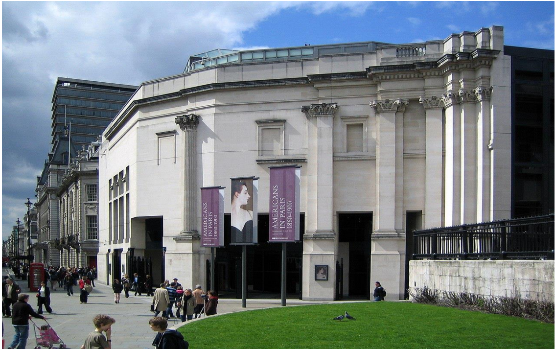
Figure 27 - Sainsbury Wing, The National Gallery in London, England, American Architect – 1991