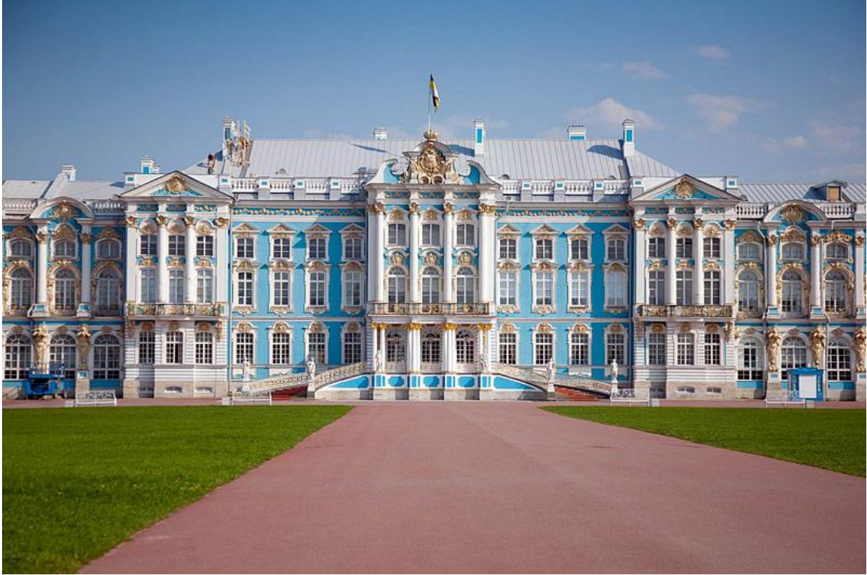
Figure 11 - Catherine Palace is in Saint Petersburg – Russia Chief architect Brtholomeo Rastrelli Strting in 1743

روکوکو دقیقاً یک سبک معماری نبود. این نوعی پاروک پراثرژی بود که توسط تعداد زیادی از هنرمندان فرانسوی ، ایتالیایی و آلمانی با نور اجرا می شد. سبک روکوکو در اواخر سال 1790 میلادی که آخرین دوره معماری پاروک به حساب می آید در فرانسه ظهور نمود، این سبک بسرعت به دیگر مناطق اروپا بخصوص ایتالیا ، آلمان ، اتریش ، اروپای مرکزی و روسیه تزاری گسترش یافت. معماران ساختمان های زیبای را در سبک روکوکو با تزئینات دقیق با خطوط منحنی یا مارپیچ خلق نمودند که مشخصه این دوره میباشد. تصویر نمونه بارز این سبک زیبا تقدیم میگردد. (شکل 11 و 12)