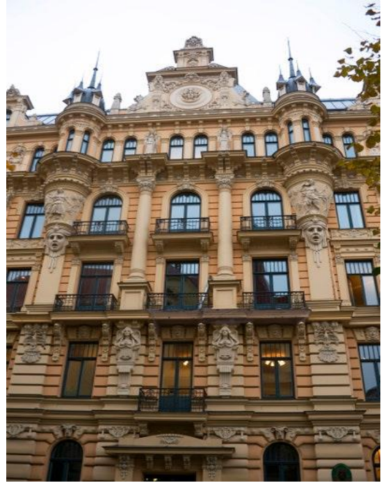
by architect Mikhail Osipovich Eisenstein Figure 16 - Apartments on Albert Street in 1901 in Riga, Latvia