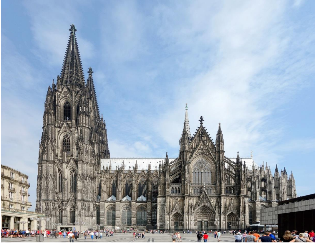
Figure 6- Cathedral in Cologne, Germany, architects, Master Gerhard, Ernst Friedrich Zwirner, Arnold Wolff- 1322