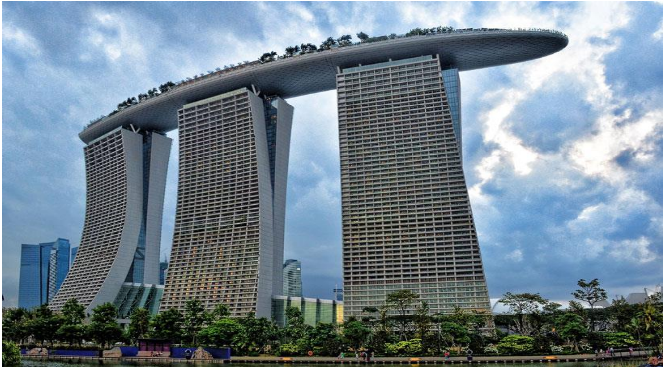
Figure 31 - Marina Bay Sands Resort in Singapore, Canadian architect Moshe Safdie, 2011