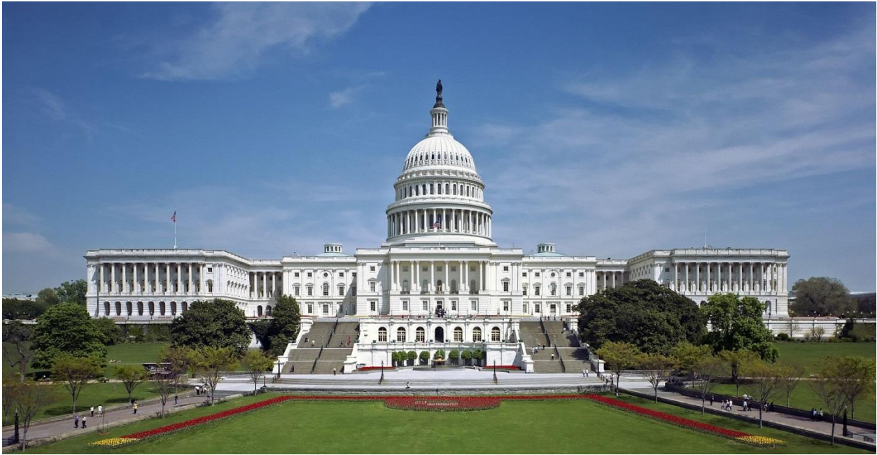
Figure 13 -The Capitol Building, Washington, D.C. one of the architects Benjamin Henry Latrobe