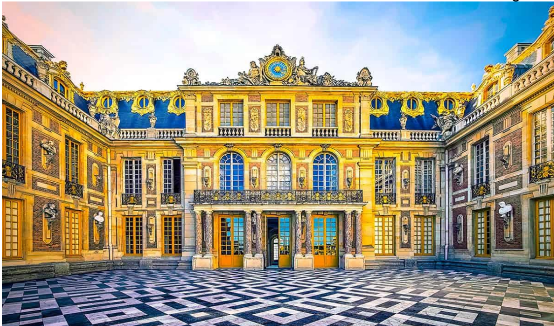
Figure 10 - Palace of Versailles near Paris, France. Architects - Louis Le Vau and André Le Nôtre - 1669