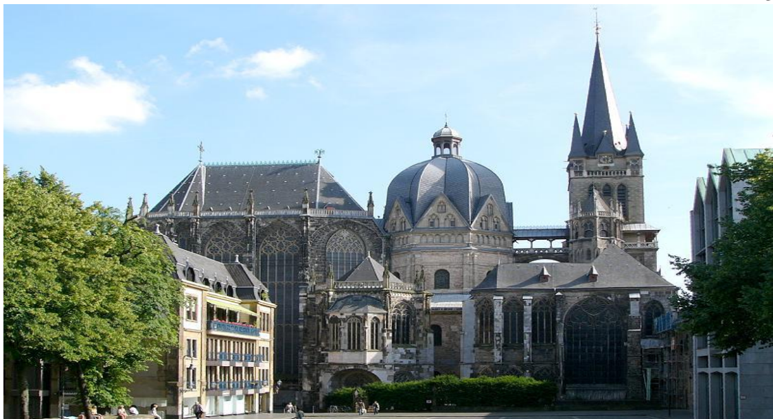
Figure 4- City Cathedral, Romansque architecture, Aachen, Germany architect Odo of Metz – 796