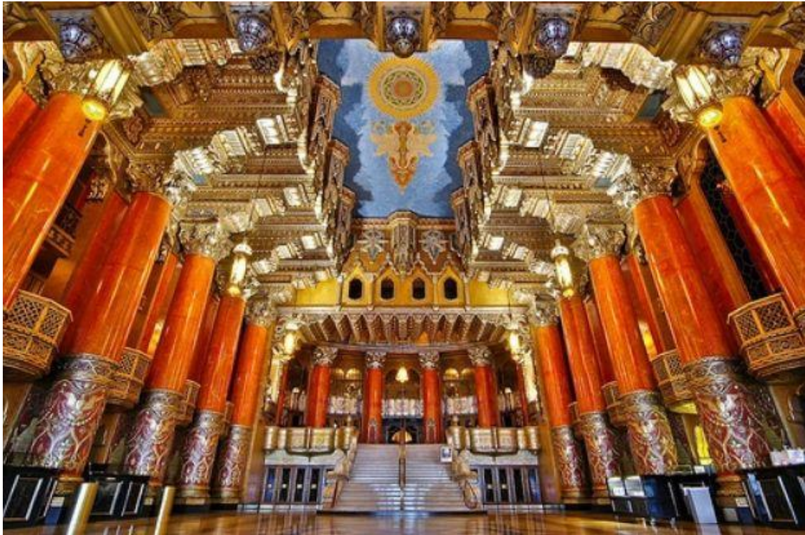
Figure 20 - Interior's view of Fox Theatre in Detroit Michigan, architect Charles Howard Crane-1928