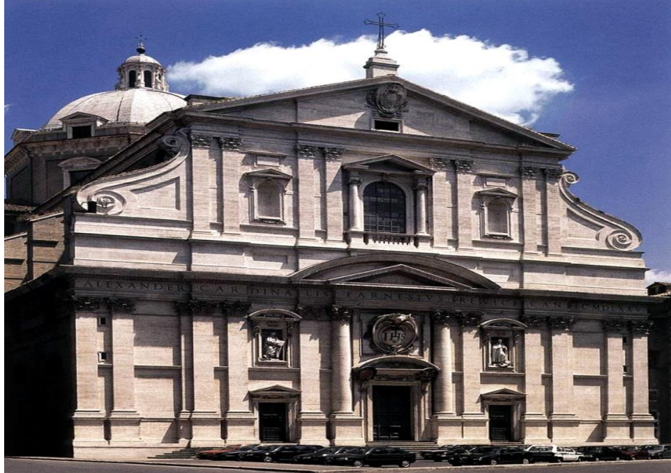
Figure 9 - Church of the Gesù, Rome, Italy. (The first Baroque view) Architect - Giacomo Barozzi da Vignola