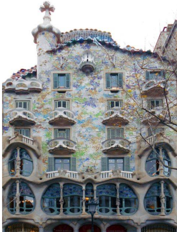
Figure 15 - Casa Battlo Redesigned in 1904 by architect Antoni Gaudi in Barcelona, Spain

در شرق اروپا فعالیت های معمار (Mikhail Osipovich Eisenstien) راکه در راستای سبک هنر معماری نو (Art Nouveau) در شهر ریگا (Riga) پایتخت کشور لاتویا (Latvia) انجام داده است نباید نادیده گرفت، زیرا آپارتمان های زیبا را در سرک آلبرت (Albert Street) طراحی نموده است. (شکل 15 ، 16 و 17)