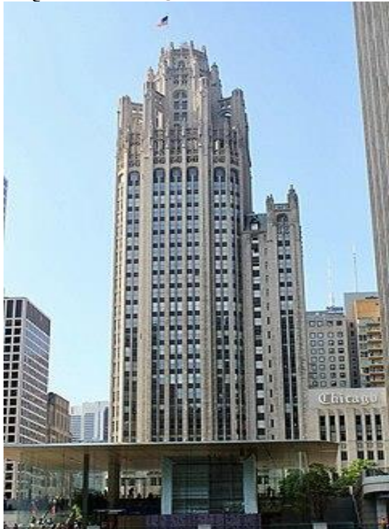
Figure 18 - Chicago Tribune Tower, architects: Raymond Hood, John Mead Howells, J. Andre Fouilhoux, John Vinci, Edward J. Burling – USA - 1924

باید اظهار داشت که شاخصه این سبک دکوریشن داخلی و طراحی داخلی باتزیئینات زیاد بود. این سبک از کلیساهای بزرگ گوتیک و دیگر معماری قرون وسطایی برای ساختمان های بلند منزل الهام گرفته است. آسمان خراش شیکاگو تریبون که در شیکاگو-آمریکا در سال 1924 اعمار گردید نمونه خوبی از معماری نئوگوتیک در آمریکا است ، انگیزه های سبک معماری نئوگوتیک را می توان در قسمت بالای برج به وضوح مشاهده کرد.(شکل 18)