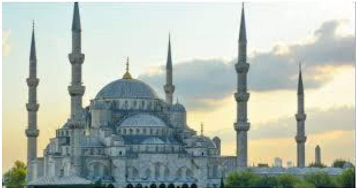
Figure 3 -Hagia Sophia Mosque and Museum, Byzantine Architecture in Istanbul – Turkey, Desiners

بهترین نمونه موزاییک کاری ها در دیوارهای داخلی میباشد که صحنه های آفرینش، تصویر شده اند و نمونه بارز آن مسجد ایا صوفیه در استانبول است ، که در حال حاضر مسجد و موزیم آثار تاریخی جمهوری ترکیه میباشد. (شکل 3)