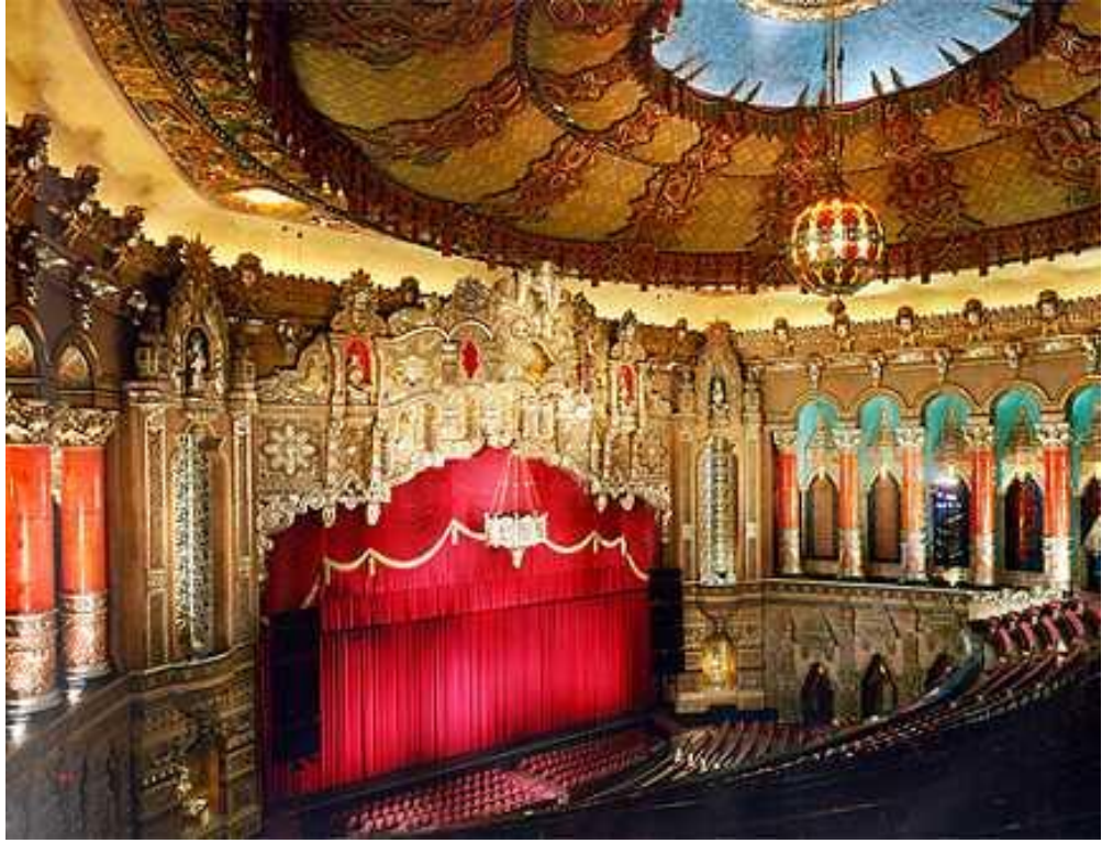
Figure 19 - Interior's view of Fox Theatre in Detroit Michigan, architect Charles Howard Crane-1928