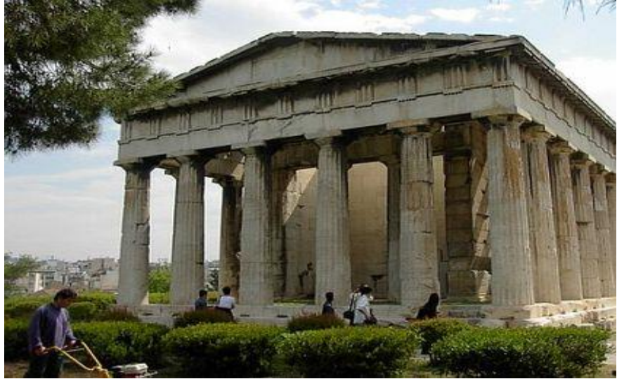
Temple of Hephaestus in Athens dates back to 449 BC.- Use of-Doric architectural style Figure 1

در روم قدیم ساختمان آمفی تناتر در پهلوی ساختمان دیگر مورد علاقه خاص رومیان قرار داشت و با اخذ الهام از استادیوم های نیم دایره یونان باستان آنرا تکامل دادند و نمونه بارز آن ساختمان آمفی تیا ترکولوسنوم (Colosseum) است که در حدود سال 70 میلادی بنا نهاده شد و ساختمان بیضوی شکل آن با داشتن ظرفیت زیاد از پنجاه هزار تماشاچی حدود ده سال به درازا کشید، البته در زیر زمینی صحنه تیاتر جای نگهداشت برای حیوانات و سامان و آلات ضروری ، اعمار شده بود . درین ساختمان شگفت آور، رومی ها از هر سه نوع ستون های دور باستان مانند ، دوریک (Doric order)، آیونیک (Ionic order) و کورینتین (Corinthian order) برای تزئین نمای بیرونی ساختمان کار گرفتند. ازین ساختمان با عظمت برای میزبانی ها، برنامه های تفریحی ، مسابقه های خونین تن به تن گلاادیاتورها ، رفتن گلاادیاتور به مصاف حیوانات وحشی و همچنان جهت اعدام محکومین استفاده به عمل میآمد.(شکل 2)