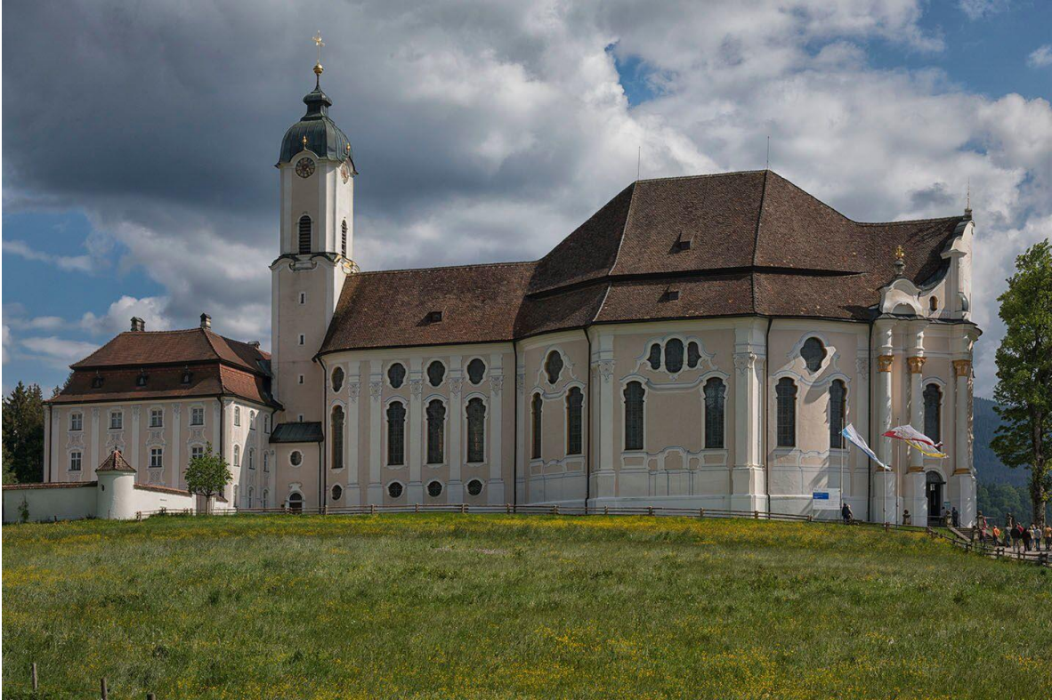
Figure 12 -Church of the Weiss in Steingaden, Germany. Architect Dominikus Zimmermann - 1754