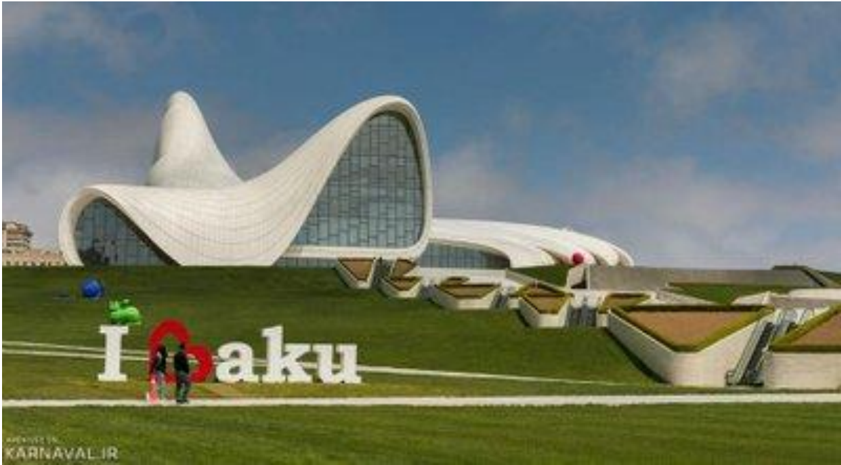
Figure 30 - Heydar Aliyev Centre, Baku, Azerbaijan, architect Zaha Hadid, 2012