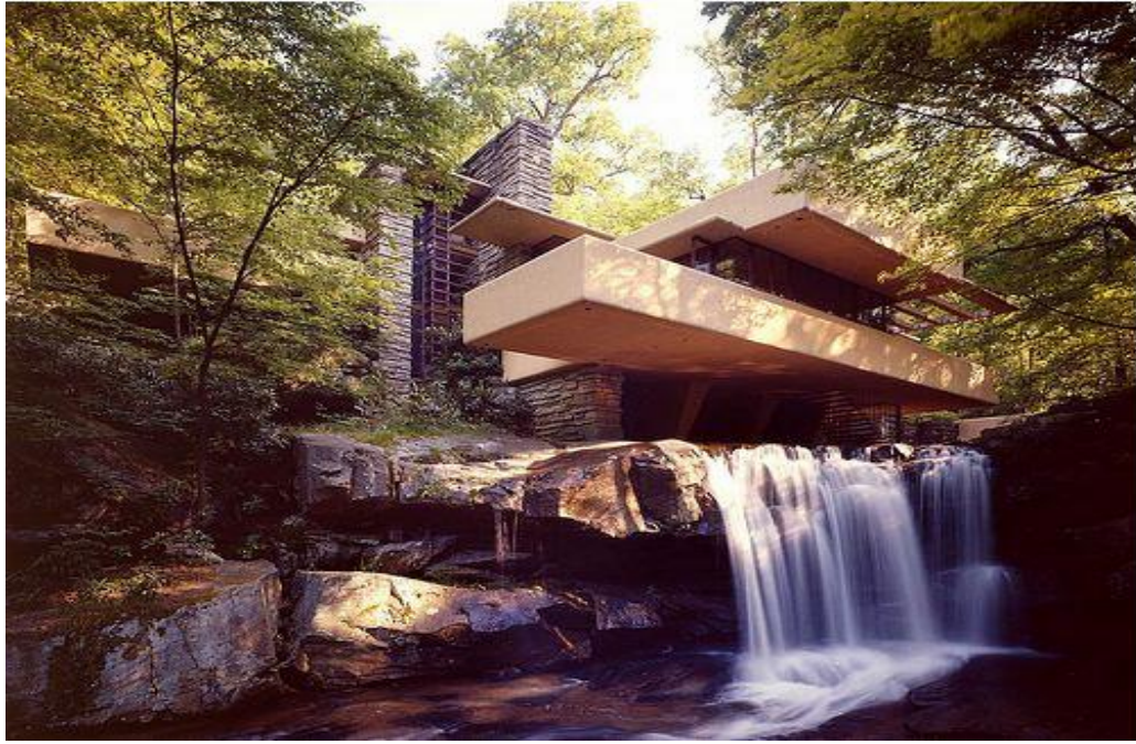
Figure 24 - Waterfall in Pennsylvania – USA- Architect, Frank Lloyd Wright – 1936-1939

نمونه دیگری از سبک هنر معماری مدرن اوپرا هوس سدنی -آسترالیا (Sydney Opera House - Australia) را نباید فراموش کرد که توسط مهندس دینمارکی (Jorn Utzon-Danish Architect) طراحی و در سال 1973 اعمار گردید. (شکل 25)