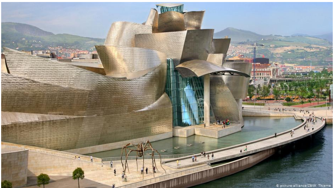
Figure 28 - Guggenheim Museum in Bilbao, Spain, Architect Frank Gehry (Canadian American) – 1997