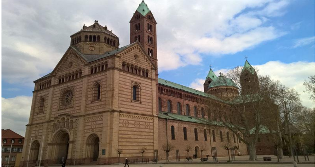
Figure 5- Speyer Cathedra Basilica in city Speyer, Germany, Opend 1106

چهارم. سبک معماری رومانسک (Romanesque architectural style): این سبک معماری وابسته به دوران قرون وسطی اروپا می باشد که در قرن 10 میلادی آغاز و تا قرن 12 الی ظهور سبک گوتیک ادامه داشت، سبک رومانسک عناصری آمیخته از معماری باستانی روم و بیزانس را با ویژگی های همچون طاق های نیم دایره، ستون های عظیم، برج های بزرگ و دیوار های ضخیم، در خود جا داده است. در آلمان یکی از مشهور ترین ساختمانهای سبک رومانسک، کلیسای بزرگ اشپیر (Speyer Cathedral) است. کلیسای بزرگ دورام (Durham Cathedral) در انگلستان همچنان مشمول دوره رومانسک میباشد. (شکل 5)