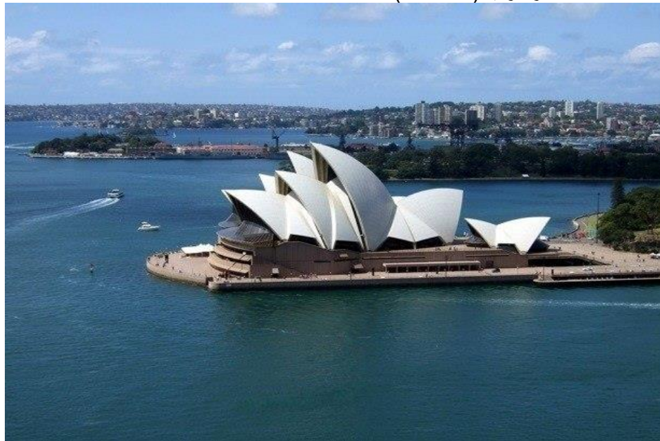
Figure 25 - Opera House in Sydney- Australia-Architect, Jorn Utzon – 1973

نمونه دیگری از سبک هنر معماری مدرن اوپرا هوس سدنی -آسترالیا (Sydney Opera House - Australia) را نباید فراموش کرد که توسط مهندس دینمارکی (Jorn Utzon-Danish Architect) طراحی و در سال 1973 اعمار گردید. (شکل 25)