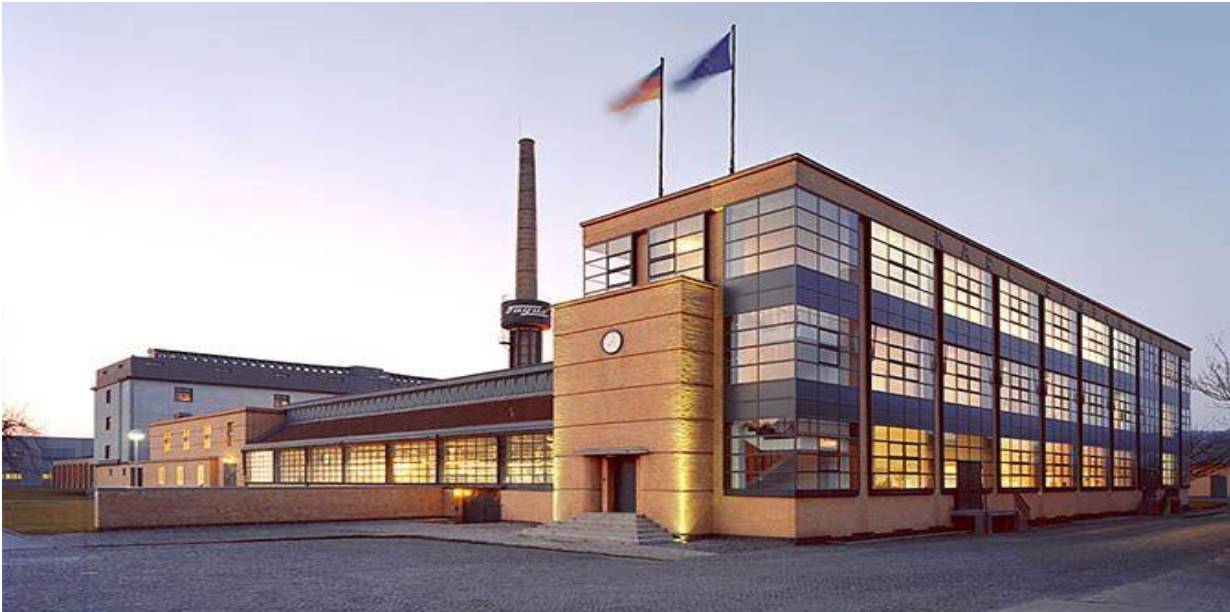
Figure 21 - Fagus Factory in Alfeld, Germany one of the earliest works and the finest 11 masterpiece of modern architectural style of Walter Gropius – 19 لازم به ذکر است که یک تعداد مهندسان باوهوس که به شیکاگو مهاجرت نمودند، باوهوس جدید را در آن شهر تاسیس و به تدریس شاگردان جوان ادامه دادند. بنابراین، لودویک میس ون درروهه بعد از مهاجرت در سال 1937 به آمریکا و اقامت در شهر شیکاگو، در باوهوس جدید به حیث رئیس آن انتخاب شد، که بعداً بنام انستیتوت تکنالوژی ایلینوی تغییر نام یافت، و در سال 1956، این استاد و معمار مدرنیست، ساختمان جدید موسسه فناوری در ایلینوی شیکاگو را طراحی نمود. (شکل 22)