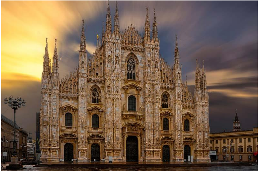
Figure 7 - Cathedral in Milan, Italy, It is the largest church in Italy, architects: Donato Bramante, Giovanni Antonio Amadeo, and more – construction began in 1386 and completed 1965