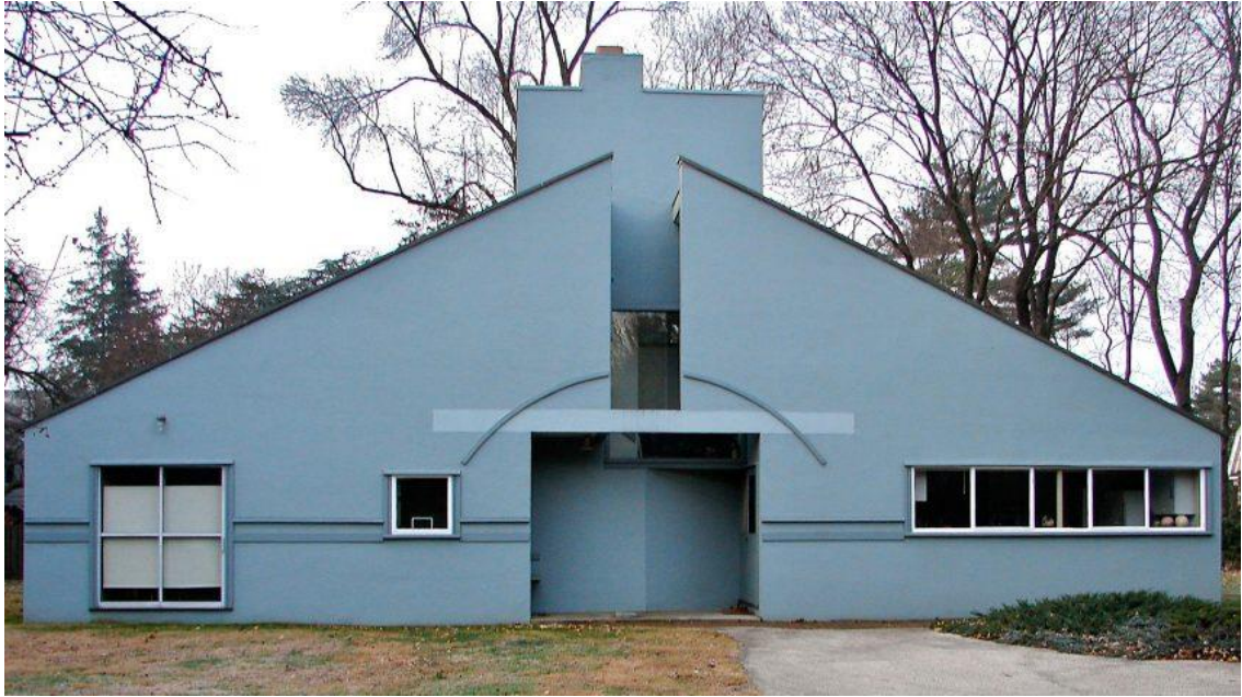
Figure 26 - House in Philadelphia, USA, Architect Robert Venturi – 1950

واوایل 1970 ظهور کرد. نظریه پردازان و مهندسان برجسته سبک پست مدرنیسم ، در جهانی بی نهایت سیر می کنند و تنها یک مسیر را دنبال نمی کنند ، به عبارت دیگر زیبایی شناسی مدرنیسم یکنواخت آنها را راضی نمی کند. از پیشروان مطرح و مهندسان نظریه پرداز سبک هنر معماری پست مدرنیسم ، معمار رابرت ونتوری (Robert Venturi) ، مهندس دنیس اسکات برون (Denise Scott Brown) و مهندس فیلیپ جانسون (Philip Johnson) شناخته شده اند، خصوصاً در سالهای 1980 و 1990 میلادی ونچوری و جانسون آنها به شگوفائی رساند. اولین بنای پست مدرنیسم خانه بود که رابرت ونتوری در دهه 1950 برای مادرش طراحی نمود و هم یکی از خلاقیت های رابرت ونتوری در اروپا ، کامل کردن یک جناح گالری ملی ساینز بری در سال 1991 در لندن می باشد. همچنان درین راستا طراحی برجسته موزیم گوگنهایم شهر بلبائو، را توسط مهندس کانادائی - آمریکائی فرانک گری (Frank Gehry) در کشور هسپانیه ، نباید فراموش کرد. این ساختمان ، نماینگر معماری با شکوه و طراحی مبهوت کننده است و یکی از پیشگامانه ترین معماری قرن بیست به شمار می آید. (شکل 26، 27 و 28)