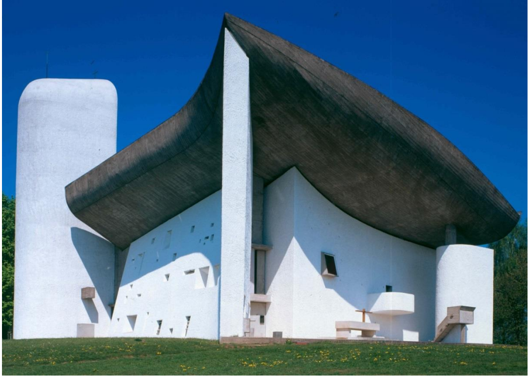
Figure 23 - Notre- dame du Haut, Roman Catholic chapel in Ronchamp, France – Architect Le Corbusier - 1955

نا گفته نباید گذاشت که یکی از پیشتازان سبک هنر معماری مدرن ، مهندس بزرگ و معروف آمریکایی فرانک لوید رایت (Frank Lloyd Wright) است. خانه آبشار یکی از خلاقیت های هنری و ماندگار وی در سالهای 1936-1939 محسوب می شود و یک نمونه بی همتا و مدرن بشمار میرود که به سرعت بی نظیر در تمام جهان زبان زد مردم گردید ، اکثریت ، اتفاق نظر دارند که مهندس رایت یک هنرمند در ابعاد گسترده بود ، او خلاق ، نظریه پرداز ماهر ، نویسنده چیره دست و استاد توانا بود و شاگردان زیادی را تدریس نمود و در جنبش معماری قرن بیستم نقش ارزنده داشت. موزیم گوگنهایم در نیویارک (Guggenheim Museum-New York) اثر مقبول و آخرین یادگار فرانک لوید رایت است. (شکل 24)