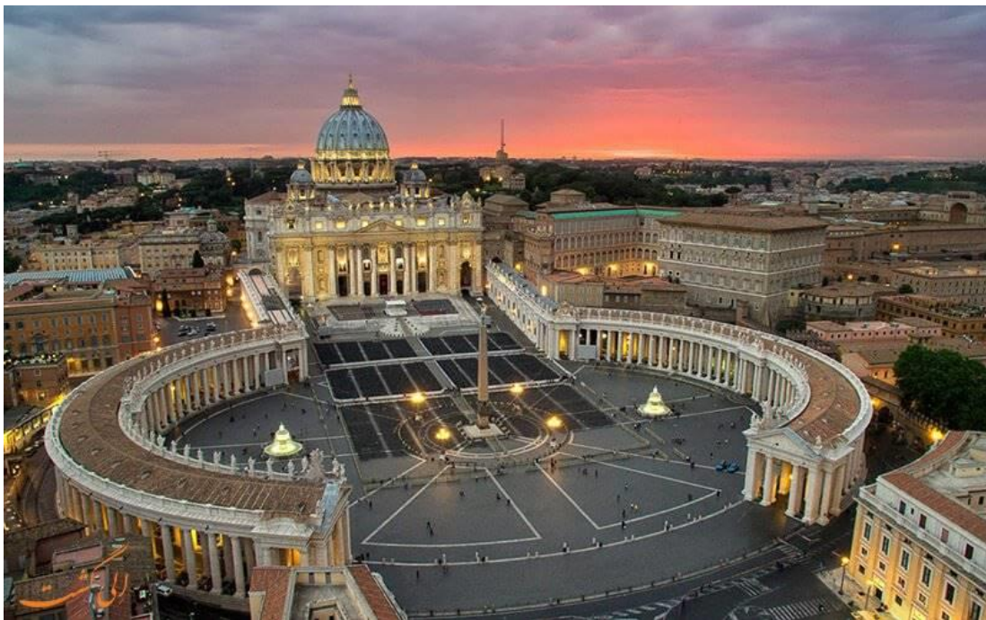
Figure 8 - Dome of St. Peter in the Vatican, Rome (Bramante, Raphael, Michelangelo) – Italy

هفتم سبک معماری باروک (Baroque architectural style): هنر معماری باروک در اوایل قرن 17 از ایتالیا آغاز و به زودی قسمت اعظم اروپا را تا نیمه قرن هژدهم به زیر چتر خود درآورد. کلیسای Gesù که بین سالهای 1568 و 1584 ساخته شده است، یکی از بهترین نمونه های معماری باروک رومی محسوب می شود. در فرانسه سبک باروک با سبک کلاسیک اتحاد کرده و تلفیق گردید و با آوردن تزئینات نمایشی زیاد پدیده معماری جدید ظهور کرد که کاخ و رسای نمونه بارز آن است. همچنان در روسیه پتر کبیر قصر سنپیترزبورگ را به آن شیوه در سال 1830 اعمار نمود. سبک معماری باروک مانند سبک گوتیک سه مرحله دارد، مرحله اولیه، مرحله پیش رفته و مرحله تکاملی. نمونه های سبک معماری باروک در سرتاسر اروپا وجود دارد. (شکل 9 و 10)