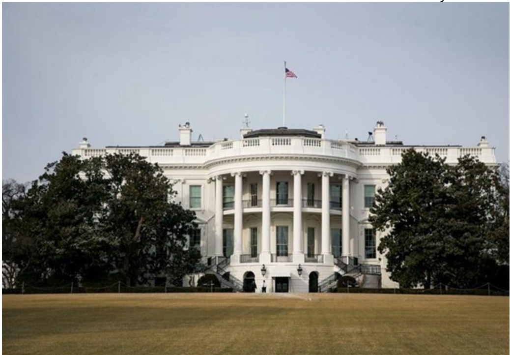
Figure 14 - The White House in Washington, D.C. by Irish born architect, James Hoban