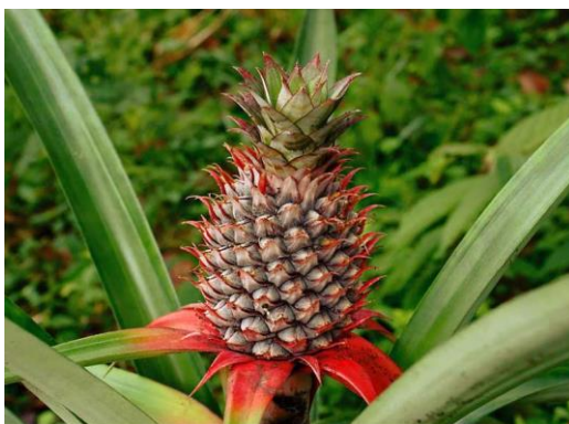
تصاویر ۱ - ۴: گل - کشت زار - میوه - گوشت میوه اناناس